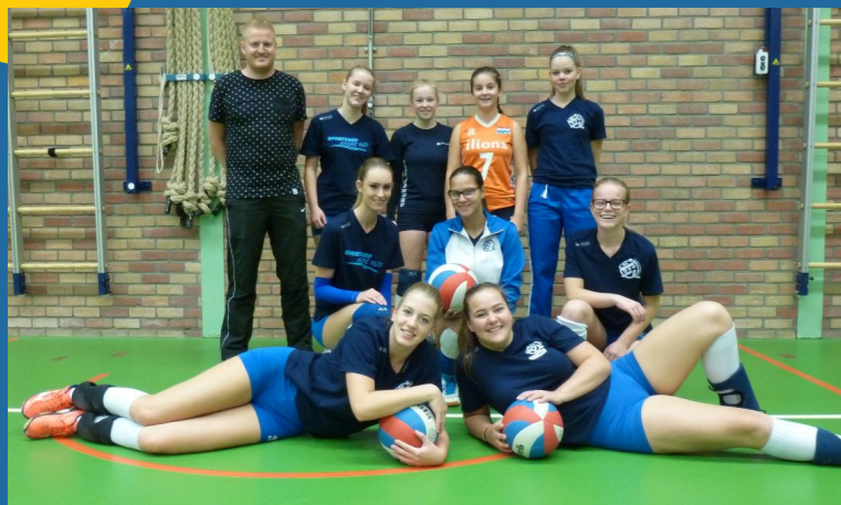
Team in de picture MEIDEN A1