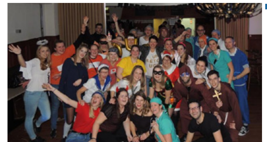
■ Geslaagd DVO DUO Feest