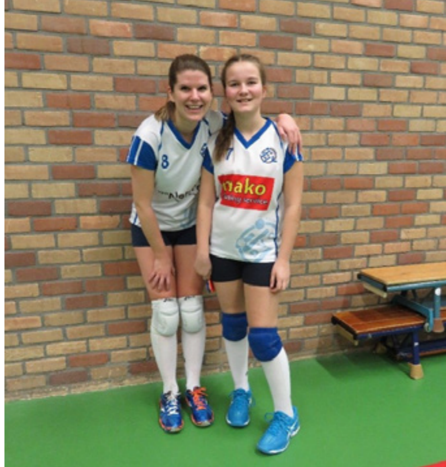
In de afgelopen maanden zijn er een aantal D- en C-teams uitgenodigd bij heren 1, dames 1 en dames