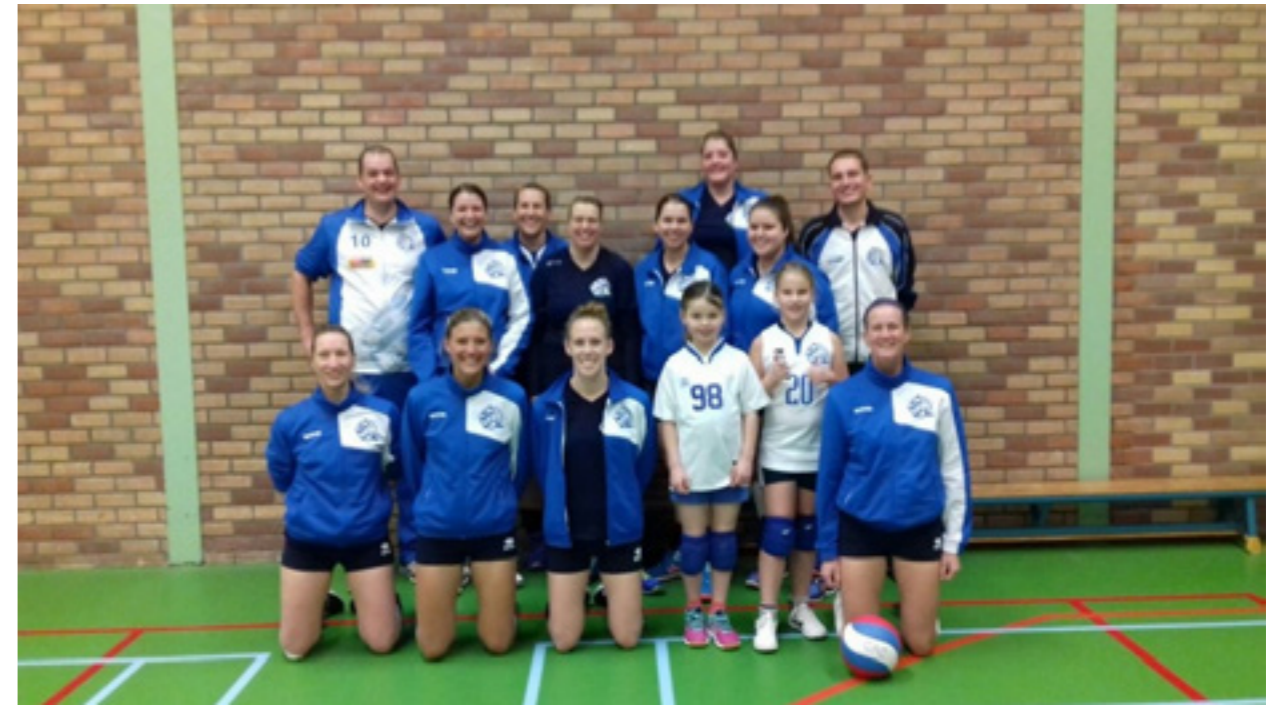
De mini's op de foto met dames 2