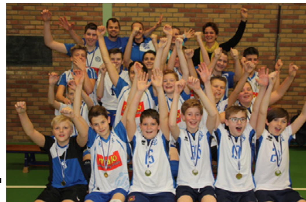
Jongens B1 en C2 kampioen

Aan het einde van de 1e competitie van de jeugd zijn 2 teams (winter)kampioen geworden. Jongens B1 en C2.