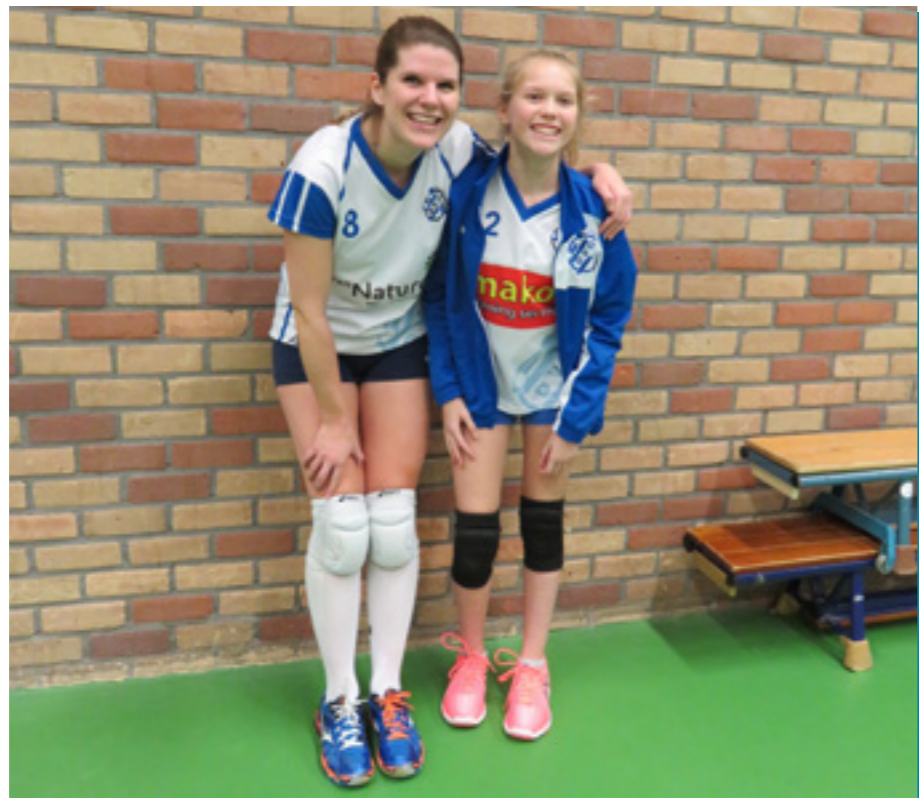
Speelsters mochten met hun favoriete speelster op de foto