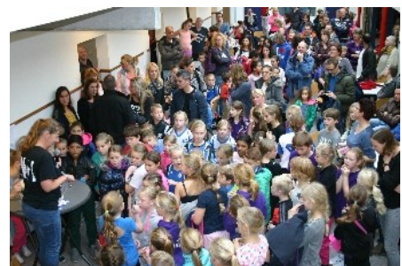
De prijsuitreiking Onze topspelers.....