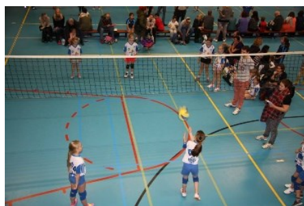
Team 2 en 3

We hadden veel supporters, Opa's, Oma's, broertjes, zusjes, iedereen kwam kijken en ons aanmoedigen!